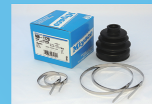
ドライブシャフトブーツ