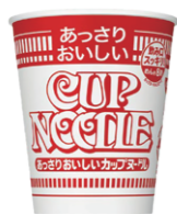
あっさりおいしい カップヌードル