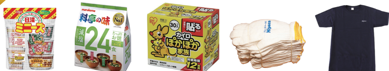
日清ミニーズ 1セット 即席味噌汁 料亭の味 24食 1袋 貼るタイプ レギュラー 使い捨てカイロ 30枚 ミヤコロゴ入り軍手 1ダース ミヤコロゴ入り Tシャツ 1枚