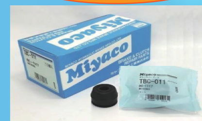
ダストカバーブーツ