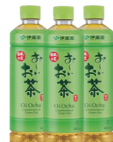
伊藤園 おーいお茶 460ml