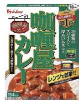
ハウス カレー屋カレー