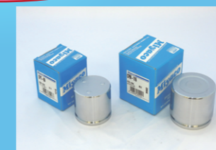
キャリパーピストン