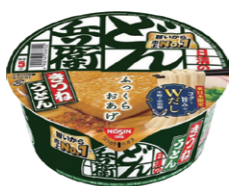
どん兵衛 きつねうどん