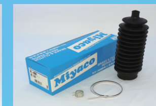
ステアリングブーツ