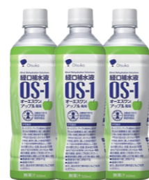
経口補水液 オーエスワン 500ml