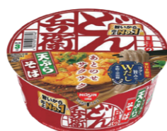
どん兵衛 天ぷらそば