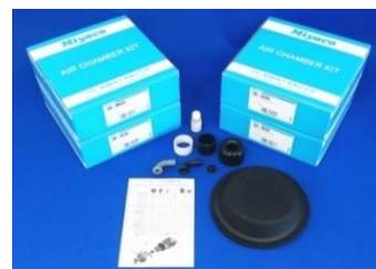
チャンバーキット取り付け図