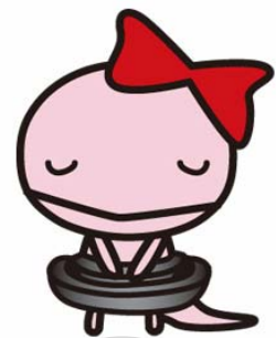
イメージキャラクター カップちゃん