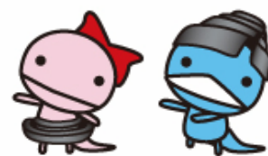
イメージキャラクター カップちゃん&ブーツくん

日頃は、ミヤコ商品をご愛用賜り厚く御礼申し上げます。 今年も皆様への感謝の気持ちを込めて 景品付謝恩セールを実施しております。 この機会に是非ご用命の程 宜しくお願ひ申し上げます。